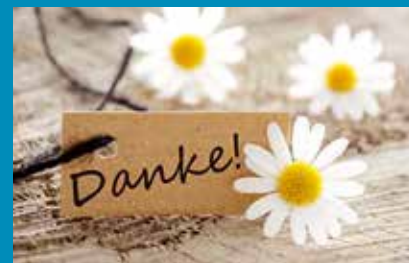
„...für die Unterstützung!“

Bei aller Theorie und trotz vieler Darstellungen, wie so eine Beratung funktioniert, bleibt es vorher oft etwas unklar, was einen erwartet. Im Zweifel kann man ein unverbindliches Erstgespräch führen. Durch das konkrete Erleben können die Ratsuchenden nach einem ersten Kontakt für sich entscheiden, ob sie sich auf einen weiteren Beratungsprozess einlassen mögen.