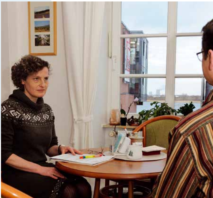
Beratung bietet Zeit und Raum zum Gespräch.

sich in (sinngemäßen) Rückmeldungen nach Paarberatungen spiegeln: