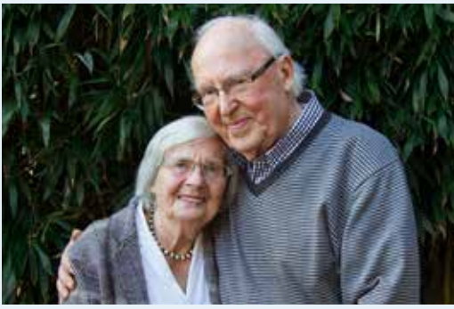
Seit 60 Ehejahren glücklich miteinander.

EFL: Welche Voraussetzungen braucht eine gute Partnerschaft, was können Eltern ihren Kindern in dieser Hinsicht vermitteln?